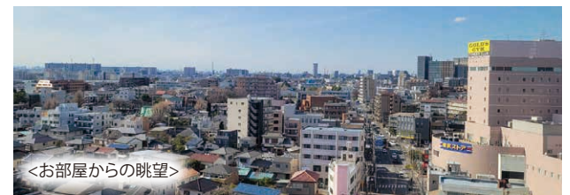
<お部屋からの眺望>